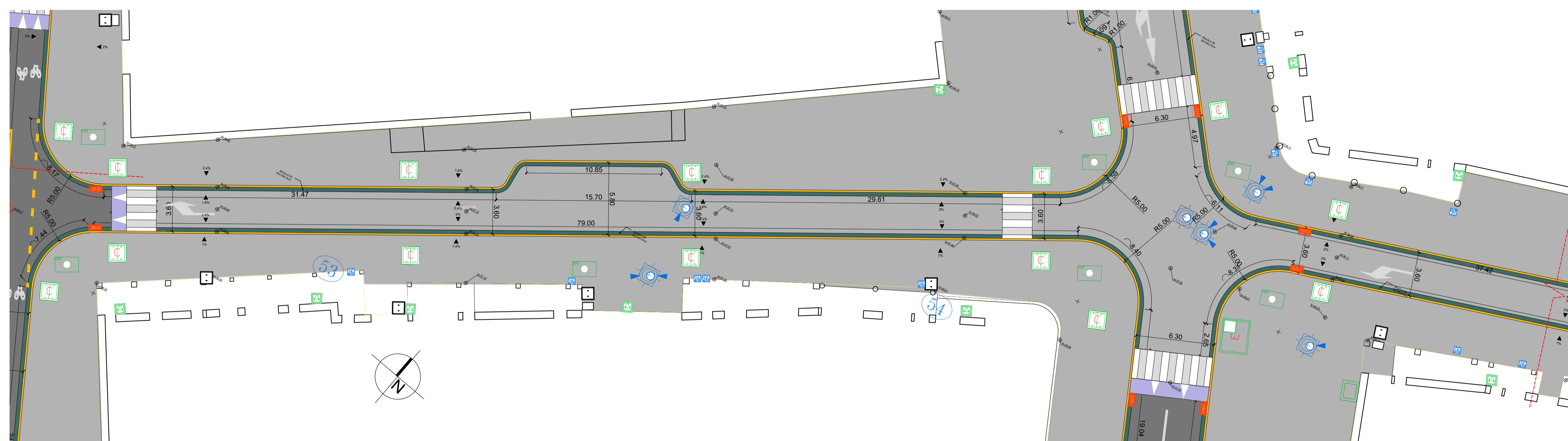
CALLE COLÓN - TRAMO 7